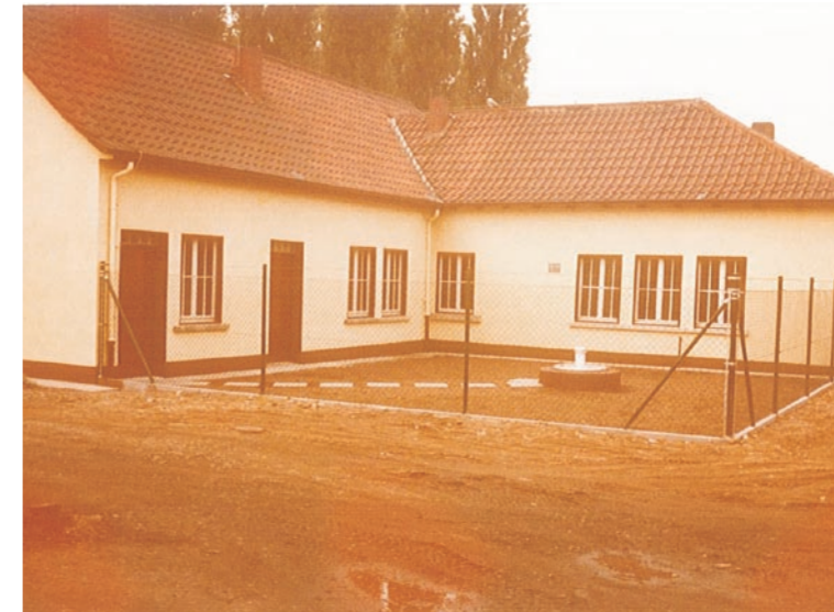
Die Stromstation am Hennigweg existiert seit dem Jahr 1954.

„Mühlheim mit zu den ersten Gemeinden des Kreises Offenbach gehörte, die um die Jahrhundertwende in den Genuss des neuen geruchfreien Energiemittels Elektrizität kamen. Wie alles, so hatte dieser damalige Vorteil in der Folge und vor allem während der letzten Jahre erhebliche Nachteile. Haushalte die ehemals drei Glühbirnen mit zusammen 150 oder 200 Watt anschlossen, hängen jetzt