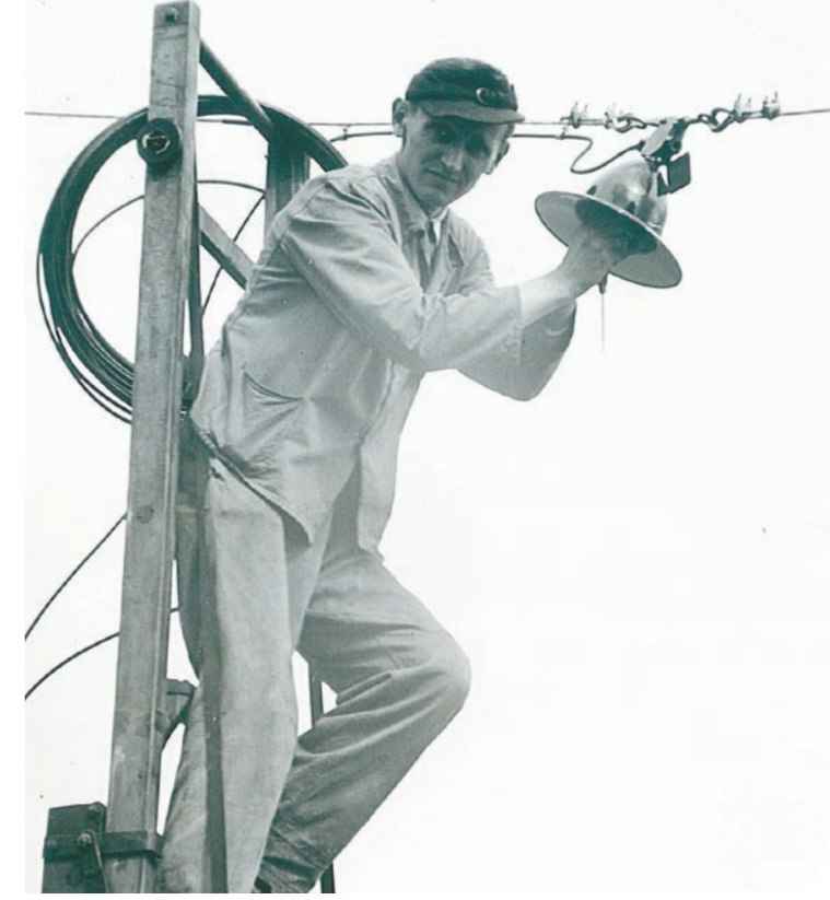
Austausch der Straßenbeleuchtung in früheren Tagen.

Diese Aufzeichnungen zeigen, dass das damalige ursprüngliche Stromnetz nicht den Anforderungen der frühen 60er Jahre gewachsen war. Also musste etwas getan werden und in diesem Zusammenhang verschwanden die Dachständer, die