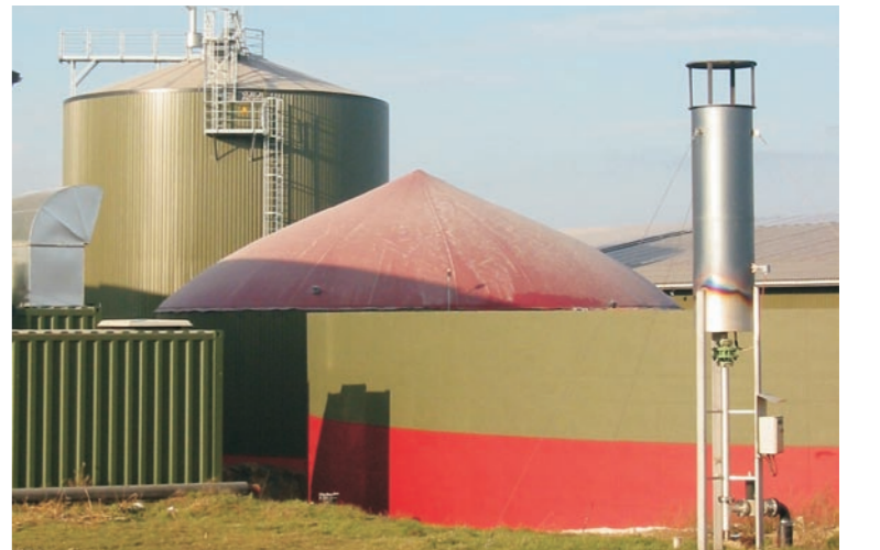
So könnte die künftige Biogasanlage in Mühlheim aussehen.

Denn eine Biogasanlage im Gewerbegebiet Donsenhard mit einer geplanten Größe von 2,7 MW elektrischer Leistung könnte umweltschonend Biogas in Erdgasqualität produzieren und das wiederum könnte Ölpreis unabhängig am Markt angeboten werden. Damit wäre Mühlheim in Zukunft ein Stück unabhängiger, die Umwelt würde geschont und die Energieversorgung der Bevölkerung der Mühlentstadt mit bezahlbarem Gas nachhaltig gesichert.