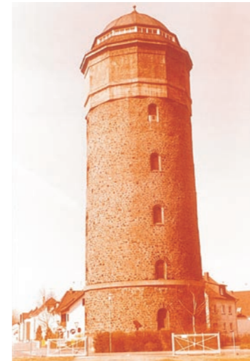
Der Wasserturm in Mühlheim.

Der Gedanke ist gar nicht so abwegig wie er zunächst klingt. Denn nach historischen Aufzeichnungen wurden im Jahr 1903 die Gasleitungen in Mühlheim verlegt, zwischen 1911 und 1914 erfolgte der Bau der Wasserleitung und die Errichtung des Wasserturms