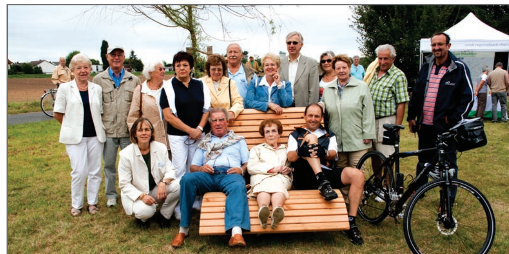
Am vergangenen Sonntag konnte der erfolgreiche Abschluss der Renaturierungsmaßnahme an der Rodaumündung gefeiert werden.

bis 22.00 Uhr – Punkt-Apotheke, Große Marktstraße 4, Offenbach, 069/887822