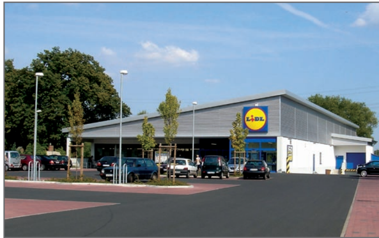
Auch der Lidlmarkt im Stadtteil Dietesheim wird gut angenommen.