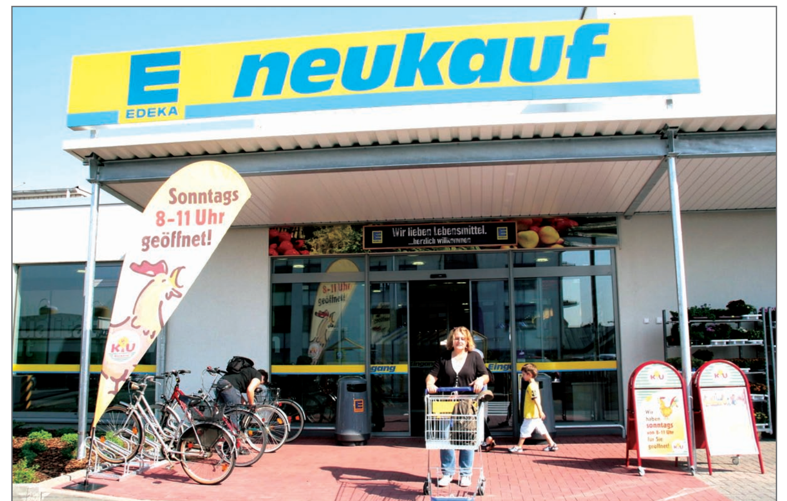
Der neue Edekamarkt an der Dietesheimer Straße wurde vor wenigen Wochen eröffnet.