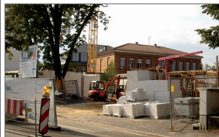
Die Bauarbeiten für das Seniorenzentrum an der Offenbacher Straße gehen zügig voran.

Mit dem geplanten Tegut-Markt in der Schillerstraße im Bereich der Spessartbrücke wird das Versorgungsnetzwerk Mühlheims komplettiert. „Er ist das i-Tüpfelchen in der Einzelhandelsstruktur“, zeigt sich Herr Till Böttcher stolz. Die Stadt kann Tegut aufgrund ihrer Bemühungen ein bareifiges Grundstück zur Verfügung stellen, das ab 2010 bebaut werden kann. Die Stadt Mühlheim konnte mit Tegut eine Firma nach Mühlheim locken, deren Konzept von anderen Lebensmittelmärkten abweicht. Neben konventionell hergestellten Lebensmitteln bietet sie auch Bioprodukte an, um der Nachfrage nach guter Qualität gerecht zu werden. Zudem sind Tegut-Märkte auch immer architektonisch interessant. So hat das Gebäude in anderen Städten beispielsweise die Form einer Pyramide oder einer alten französischen Markthalle. „Mühlheim darf sich auf ein architektonisches Highlight freuen“, macht Herr Till Böttcher neugierig. Der Trend nach oben ist in unserer Stadt deutlich auszumachen. Nicht zuletzt ist das dem Engagement, der Kooperationsbereitschaft und dem Durchsetzungsvermögen der Stadtverwaltung, des Bürgermeisters und der mitwirkenden Unternehmen zu verdanken.