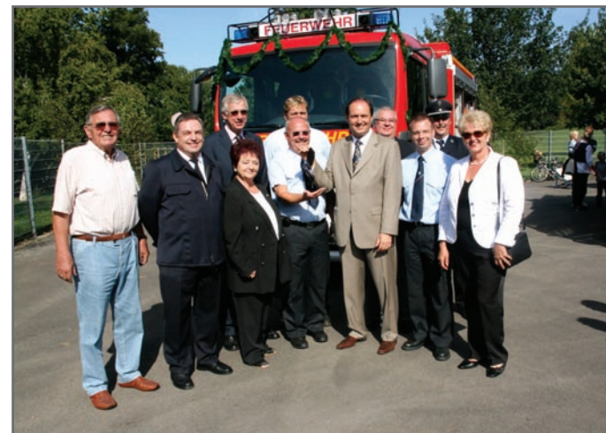
Vor wenigen Tagen konnte die Freiwillige Feuerwehr Lämmerspiel ein neues Löschfahrzeug in Dienst stellen.

bis 22.00 Uhr – Paracelsus-Apo- theke, Kaiserstraße 28, Offenbach, 069/888987