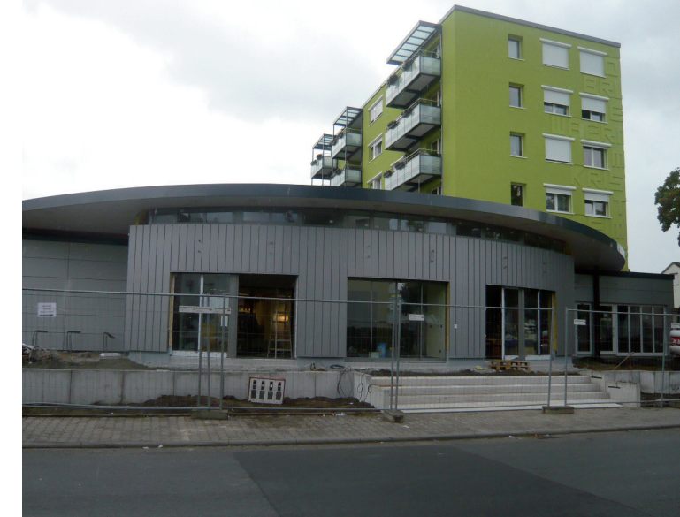
Am Sonntag, 20. September um 10:30 Uhr eröffnet der „Markt im Markwald“.

Alle Bürger sind herzlich eingeladen, bei der Eröffnung dabei zu sein. Im Anschluss an den offiziellen Teil besteht die Möglichkeit während des verkaufsoffenen Sonntags zum Einkauf und Stöbern. Parallel zur Markteröffnung findet ab 11:00 Uhr in der Ulmenstraße das große Sommerfest der WohnBau statt.