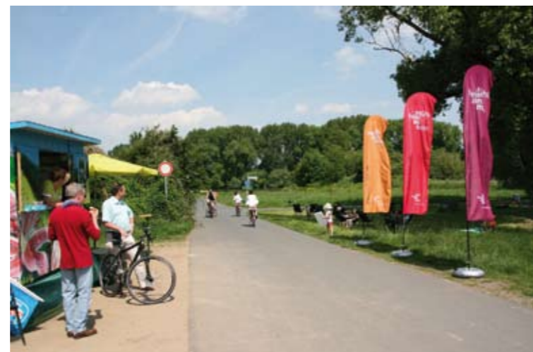
Die „Müllemer Maahütt“ an der Rodaumündung hat über die Pfingstfeiertage die Feuertaufe bestanden. Auch an der Rodau-Beach-Party werden sich die Betreiber beteiligen.

Schwanen-Apotheker, Marktplatz 8, Offenbach, 069/8090660 Bis 22.00 Uhr – Schiller-