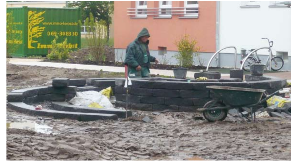
In diesen Tagen wird die begehbare Kräuterschnecke gemauert, am 12. Juni findet dann die Bepflanzung statt.

Die Bepflanzung der Kräuterschnecke bildet den Abschluss der umfangreichen Modernisierungsmaßnahme, die im März 2009 startete. Insgesamt betroffen waren 72 Wohnungen in den Immobilien Holbeinstraße 1-3, 2-4 und 6-8 sowie Gerhart-Hauptmann-Straße 18-20 und Dietesheimer Straße 67-71. Die Gebäude wurden grundhaft energetisch saniert. Ziel