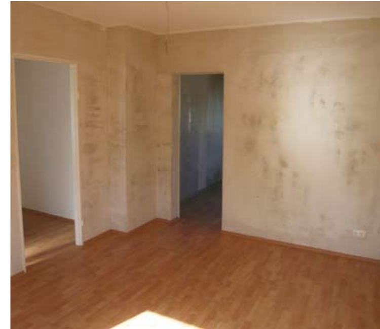
42 Wohnungen werden derzeit an moderne Wohnstandards angepaßt.

Kindertagesstätten und Schulen befinden sich in der Nachbarschaft, Einkaufsmöglichkeiten sind fußläufig erreichbar und das beliebte Naherholungsgebiet Main liegt quasi vor der Haustür: die zentrale Wohnlage Ludwigstraße/ Dietesheimer Straße und Gerhart-Hauptmann-Straße im Herzen Mühlheims ist begehrt. Unsere Häuser in diesem Areal entstanden in den Jahren um 1950 herum, die dortigen 1-, 2- und 3-Zimmer Wohnungen sind mittlerweile in die Jahre gekommen. 42 dieser Wohneinheiten werden derzeit im Rahmen von Teilsanierungsmaßnahmen an moderne Wohnstandards angepasst.