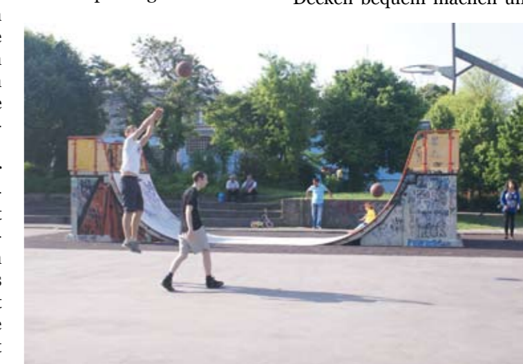
Skaterbahn und Basketballplatz sind einer der beliebtesten Plätze für Jugendliche im Bürgerpark.

malige Buckelpiste konnte zu einem glatten Boden geformt werden, auf dem die neuen Skate-Elemente ihren Platz fanden. Die Umbauarbeiten gefielen den Jugendlichen und die „Pipe“, wie sie die Skater- anlage nennen, ist zum belieb- testen Treffpunkt geworden.