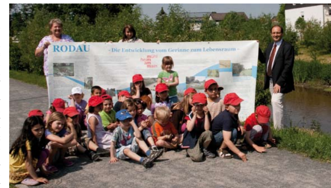
Die Vorbereitungen für die Rodau-Beach-Party laufen auf vollen Touren. Mit von der Partie ist auch die Kindertagesstätte Bürgerpark.

Die Stadt Mühlheim lädt zur Rodau-Beach-Party am 19. Juni ein